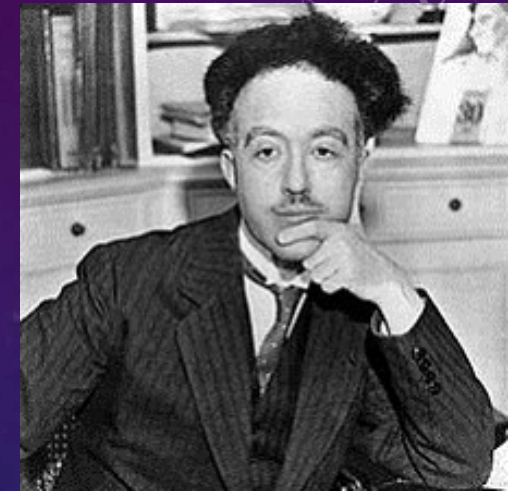
路易·德布羅意 (Louis de Broglie)